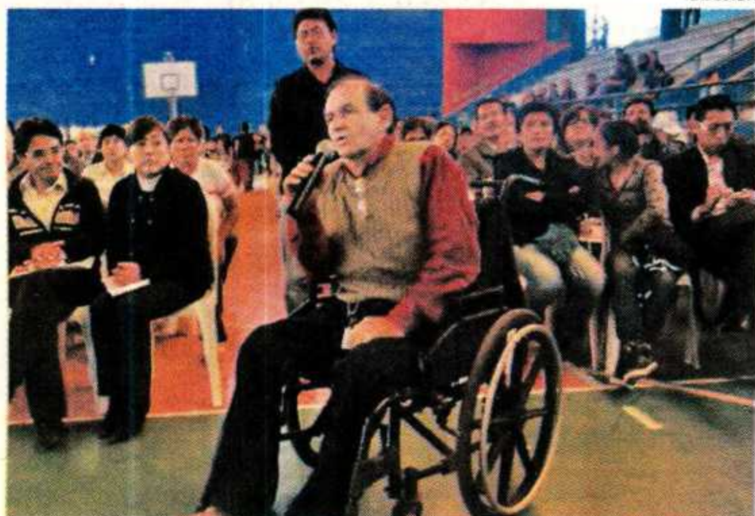
LIMA INCLUSIVA. Uno de los principales componentes del plan regional es la participación ciudadana.

Un plan como región no ha habido, pero sí un plan de Lima urbano. El cumplimiento del último plan urbano ha sido agraviado por acciones del gobierno nacional que actúa por su cuenta, que lo impone, y por alcaldes que sacan los pies del plato y, a veces, por la propia Municipalidad de Lima. Un plan vale si entra en el disco duro de cada ciudadano.