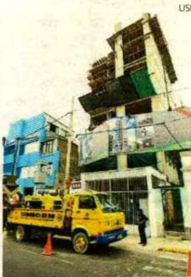
■ Nueva oferta inmobiliaria.