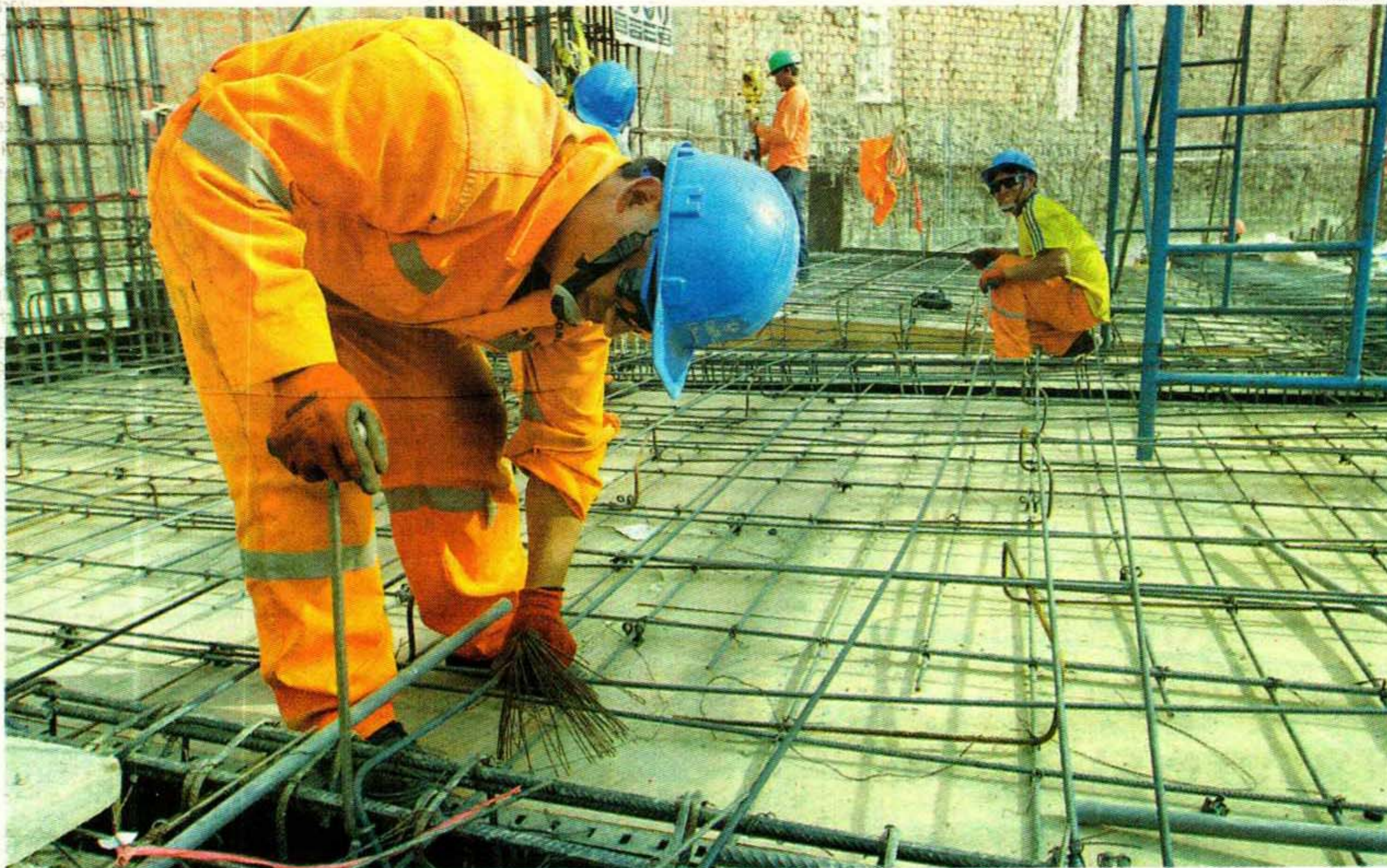
FIERRO Y CEMENTO. No hay pretexto para que más peruanos con terrenos o vivienda a medio construir no puedan edificar sus casas.