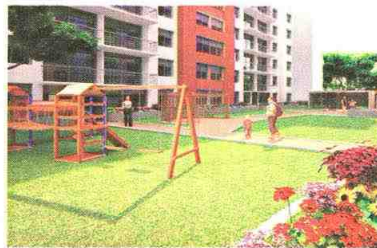
VERDE. Los niños podrán jugar en los parques interiores.

Paseo Santa Clara tendrá 155 departamentos, área de juegos para niños, salón de uso múltiple, gimnasio equipado, sala de Internet, zona de parrilla y amplios estacionamientos