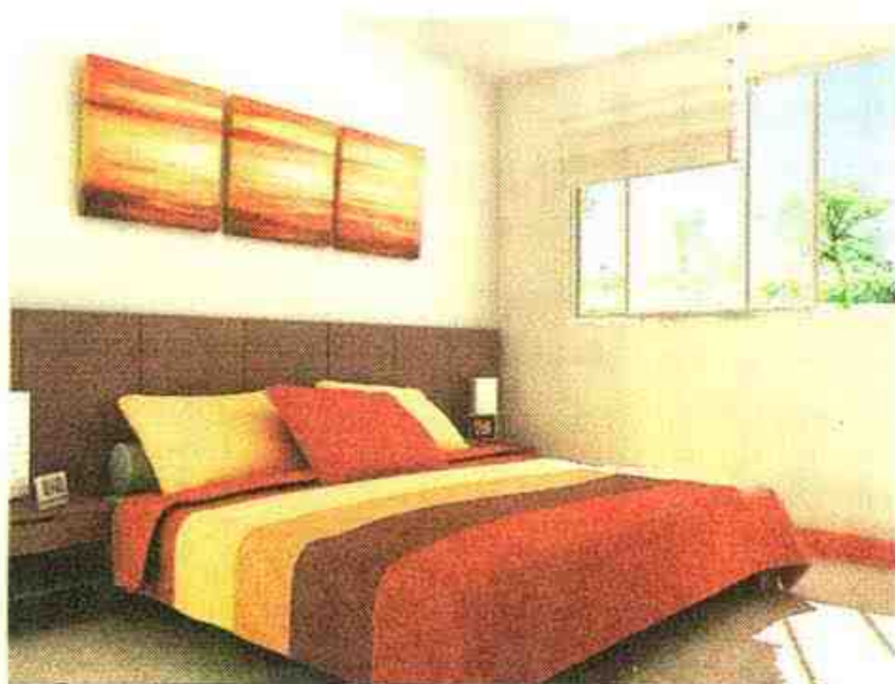
ALCOBAS. Todas las viviendas tendrán tres dormitorios.

Si está interesado ingrese a la página web: www.arteco.pe Teléfonos: 715-3240 / 715-3241