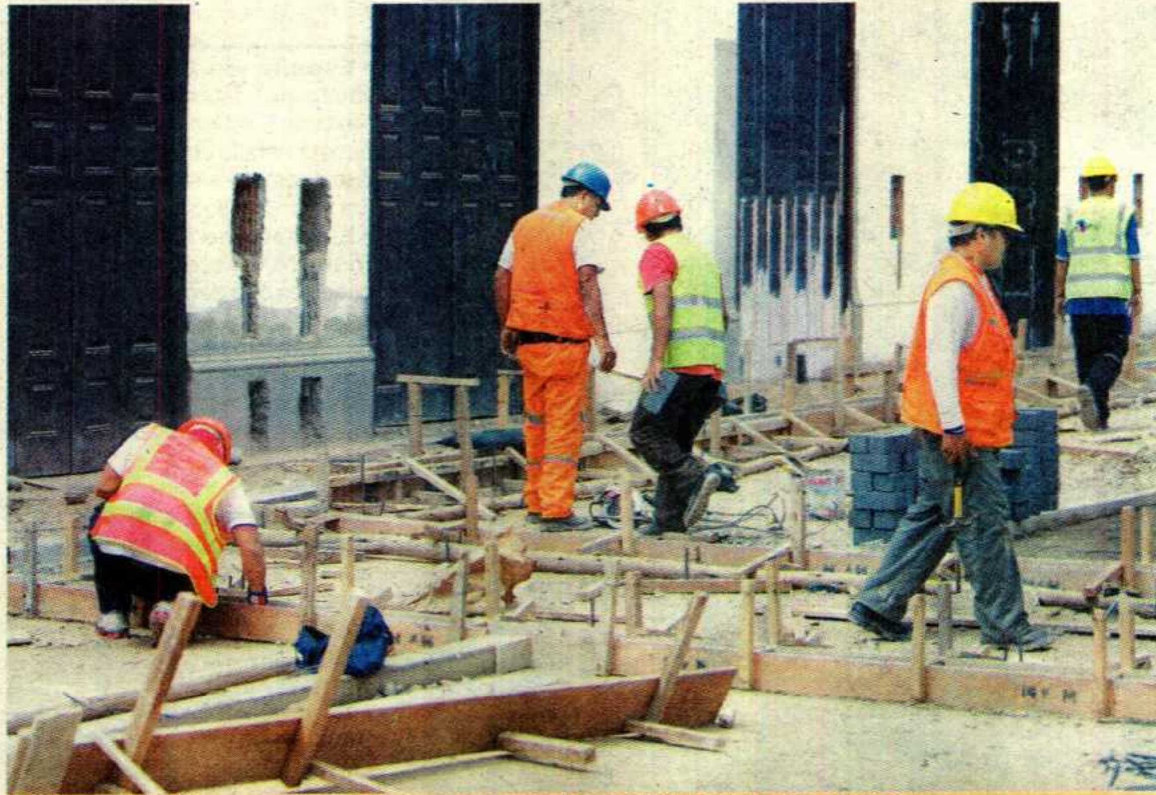
Partida. Dos millones de nuevos soles serán entregados al gobierno regional del Callao.

El ministerio tiene la función de diseñar, normar y ejecutar la política nacional y acciones del sector en materia de vivienda, urbanismo, construcción y saneamiento, así como