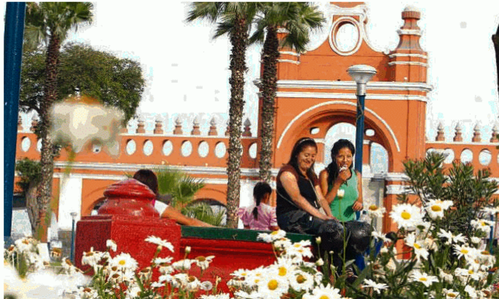
Obra. El objetivo es recuperar el valor histórico del Rímac.