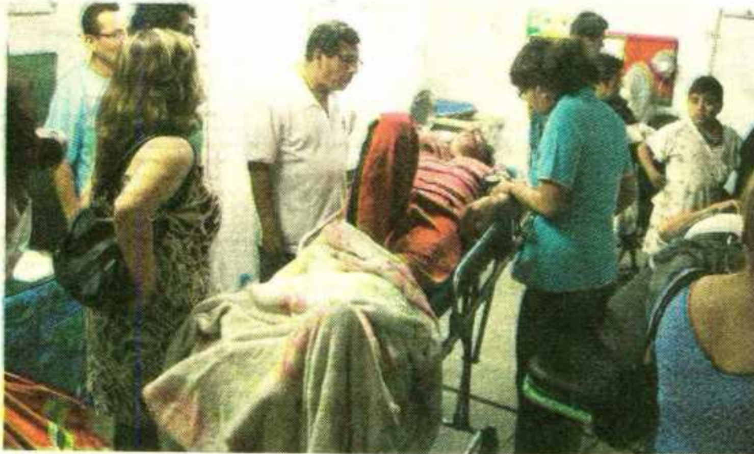
PRIMEROS AUXILIOS. Según el último reporte, los heridos llegan a 145. En su mayoría sufrieron daños leves.

Emergencia Regional de Ica reportó 145 personas heridas, 581 damnificadas y 757 afectadas, mientras que en infraestructura detectó dos viviendas colapsadas, 125 inhabitables y 150 afectadas