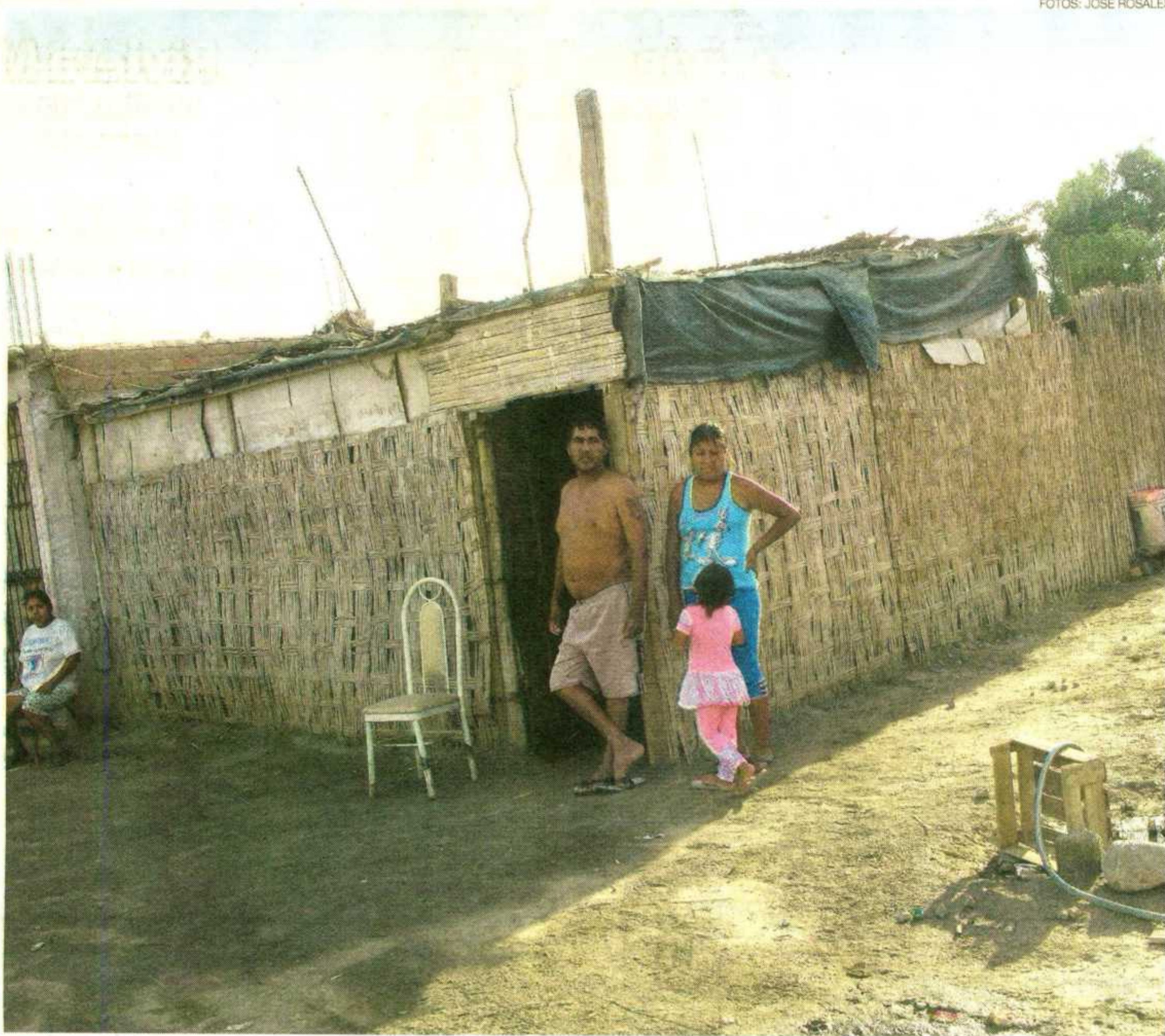
MALAS CONDICIONES. Así como estos pobladores, muchas familias de la región Ica todavía viven en módulos de esteras o plástico.

Cuando asumió la presidencia, Ollanta Humala prometió una nueva etapa en la reconstrucción de las zonas afectadas, sobre to-