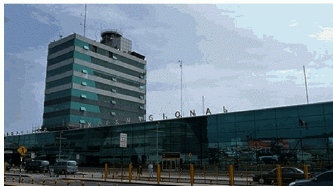
Expropiarán terrenos adyacentes al aeropuerto.

El Pleno del Congreso lo decidió con el objetivo de implementar y dotar al aeropuerto de la infraestructura suficiente .